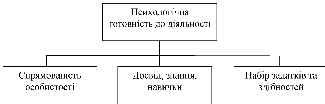
Рис. 1.3. Компоненти психологічної готовності до діяльності за А. А. Ростуновим

В структурі психологічної готовності до професійної діяльності різні науковці виділяють наступні компоненти: мотиваційний, орієнтовний, операційний, вольовий, оцінний, когнітивний, особистісний, психологічний, професійний та інші.